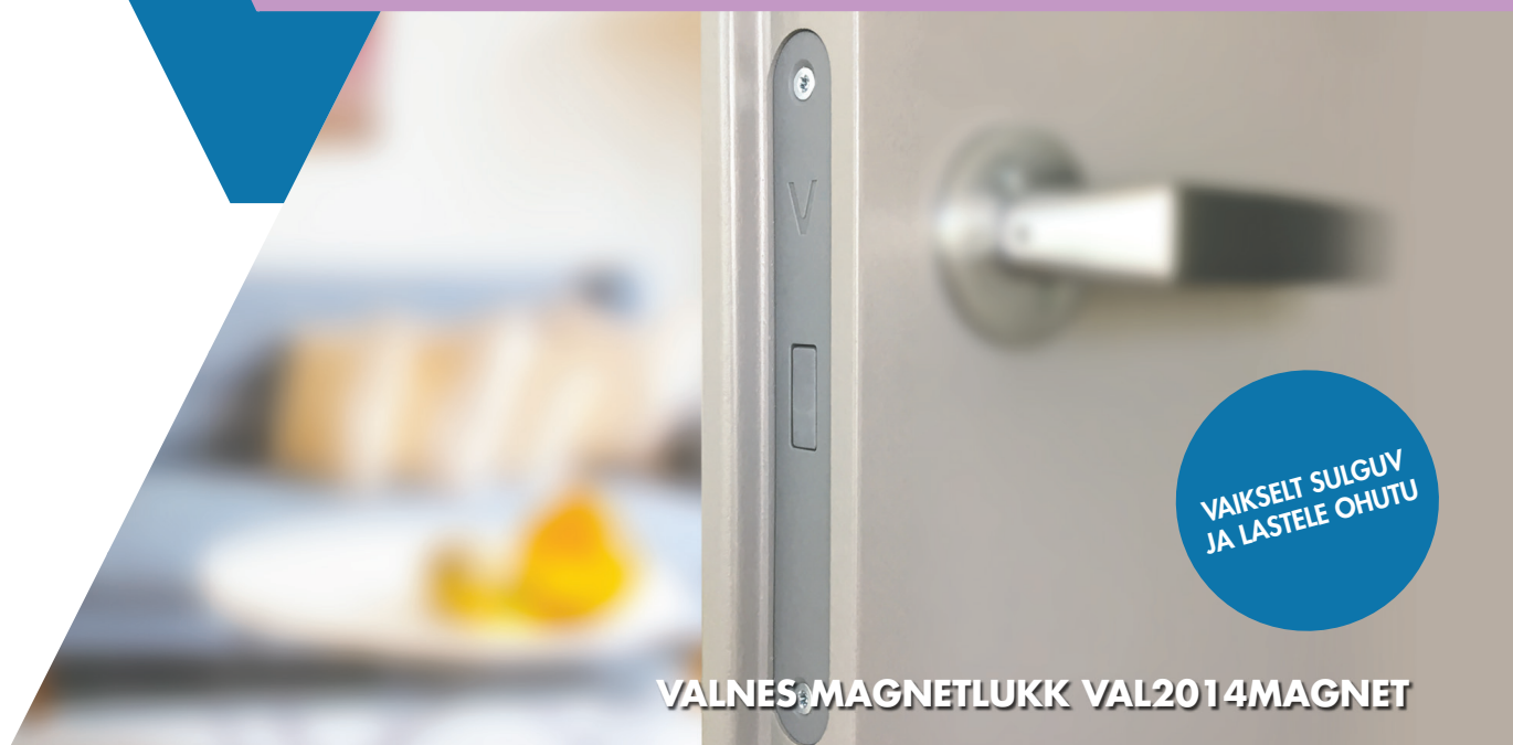
VALNES MAGNETLUKK VAL2014MAGNET

Uudistootena on müügile jõudnud siseustele mõeldud skandinaavia standardi 2014 tüüpi luku süvisesse sobituv Valnese magnetlukk . Antud lukk sobib enamike olemasolevate siseuste lukkude asemele. Toode on mõeldud kasutamiseks kõikide lengi ja uksetüüpide puhul, sest sobib skandinaavia- ja euroopa standardi ukselinkide ja wc-nuppudega . Euroopa standardi ukselingid peavad olema ilma vedruta.