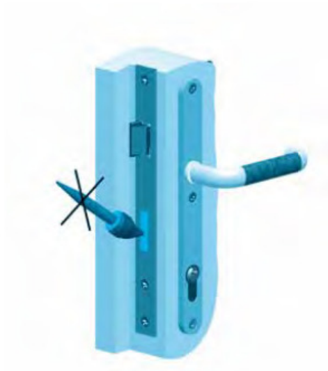
Lukukorpust ei tohi värvida

a/a 221001160812 Hansabank S.W.I.F.T. HABA EE 2X