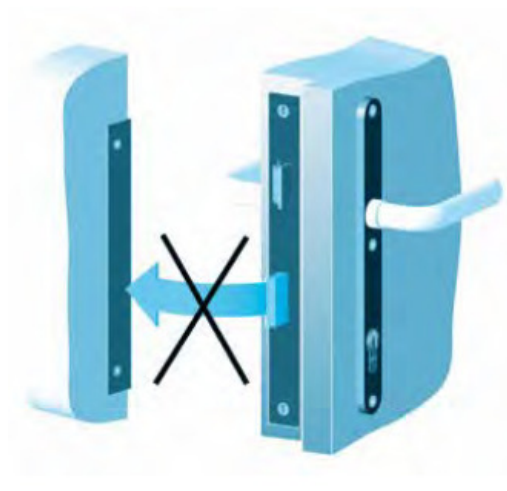
Avatud uksele ei tohi lukustuskeelt hoida lahti keeratuna