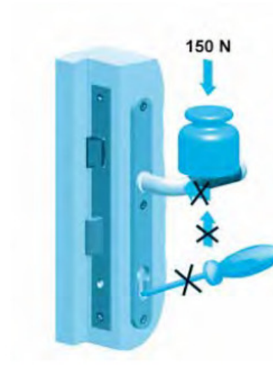
Käepideme liikumissuunas tohib rakendada jõudu kuni 150kN(kehtib EN1906 standardile vastavate käepidemete puhul)